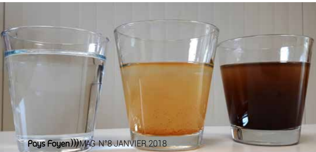
Pays Foyen)))MAG N°8 JANVIER 2018

La CdC suit très étroitement l'évolution du réseau mais le volume de travaux à réaliser est très important et nécessitera de nombreuses années pour résoudre ce problème.