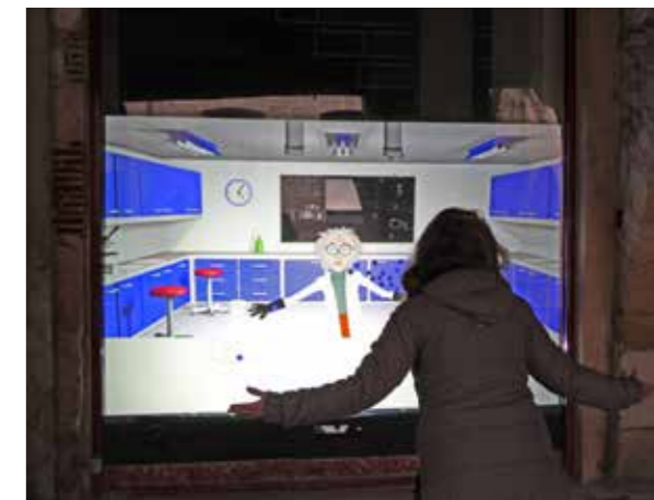
Pays Foyen)))MAG N°8 JANVIER 2018

Dans un souci de promotion de l'emploi et de lutte contre l'exclusion, la CdC du Pays Foyen a souhaité favoriser l'insertion dans le cadre des travaux de réalisation de la ZAE. L'entreprise qui s'est vue attribuer le marché public devra réaliser une action d'insertion qui permette l'accès ou le retour à l'emploi de personnes rencontrant des difficultés sociales ou professionnelles particulières. Cela consiste à réserver une part du temps total de travail nécessaire à l'exécution des travaux, à savoir 140 heures.