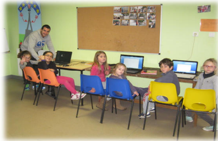
L'équipe de Rédaction de gauche à droite :

On fait des grands jeux et les plus petits font la sieste. Après les activités on prépare le goûter et même on le sert et on le mange. En attendant que papa et maman viennent nous chercher on fait des jeux de société, des dessins, on joue au baby foot.