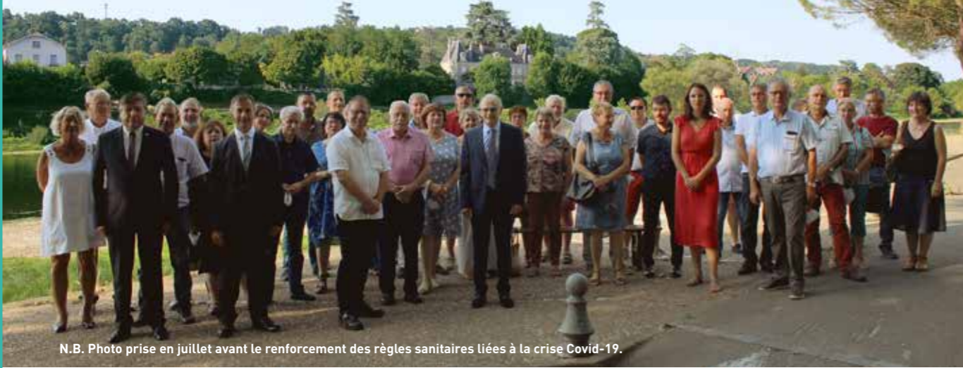
N.B. Photo prise en juillet avant le renforcement des règles sanitaires liées à la crise Covid-19.